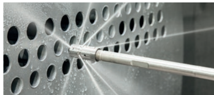
2. Gang – mittlere Pumpenleistung

Zum Beispiel für Rohr- und Wärmetauscherreinigung