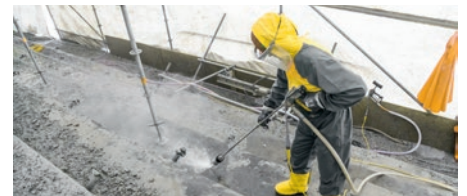
1. Gang – geringe Pumpenleistung

Zum Beispiel für Rohr- und Wärmetauscherreinigung