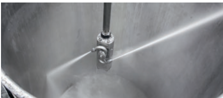
3. Gang – volle Pumpenleistung