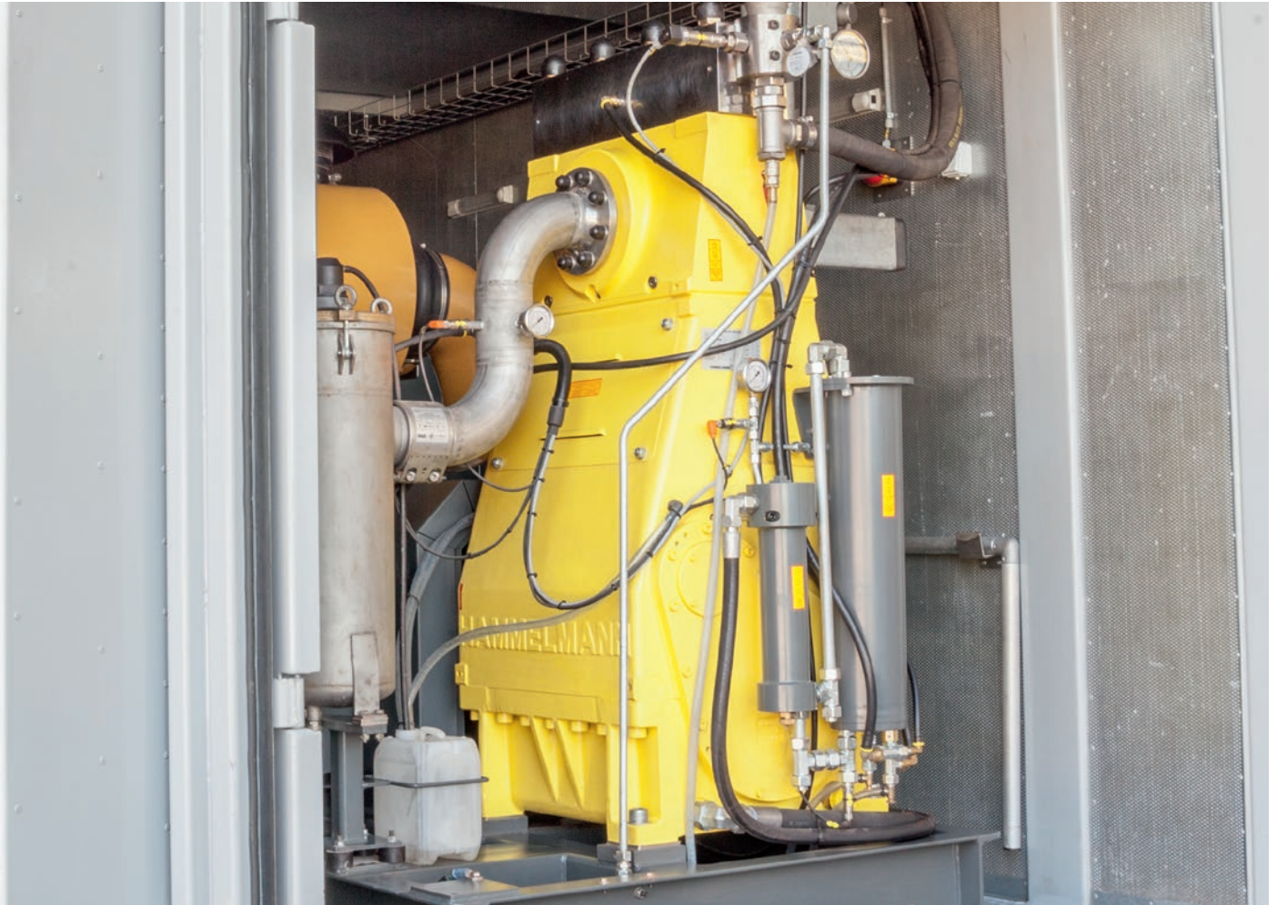
Stationäre Anlage mit Dieselmotor in einem Schallschutzcontainer